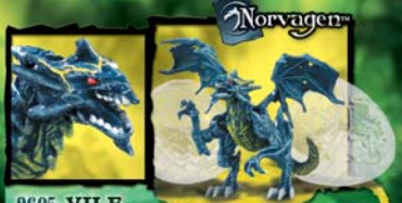
9605 VILE WIND SPRINTER DRAGON™