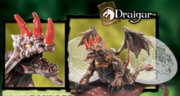
9609 BOULDER KRISTAL CAVERN DRAGON™