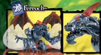
9607 SETHR METAL SLASH DRAGON™