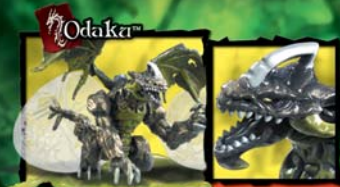
9606 BRIMER DARK CLAW DRAGON™