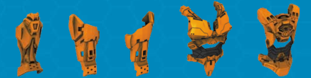
2X AS2969919 IX AS2969911 IX AS2969912 IX AS2969915 IX AS2969916