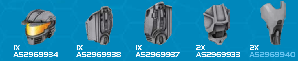
IX AS2969934 IX AS2969938 IX AS2969937 2X AS2969933 2X AS2969940