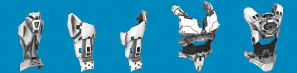
2X AS2969929 IX AS2969921 IX AS2969922 IX AS2969925 IX AS2969926