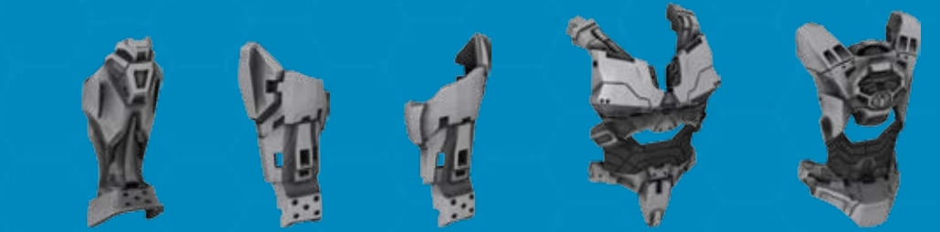
2X AS2969939 IX AS2969931 IX AS2969932 IX AS2969935 IX AS2969936