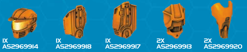
IX AS2969914 IX AS2969918 IX AS2969917 2X AS2969913 2X AS2969920

EN Please read these instructions carefully before first use and keep them for future reference. ES Leer estas instrucciones cuidadosamente antes de la primera utilización y guardarlas para referencia futura. FR Il est recommandé de lire attentivement ce feuillet avant la première utilisation et de le conserver pour référence future. DE Die Gebrauchsanleitung bitte durchlesen und aufbewahren. NL Wij raden u aan deze handleiding zorgvuldig te lezen en te bewaren voor eventuele raadpleging op een later tijdstip. IT Leggere le istruzioni prima di cominciare ad usare il gioco e conservarle per referenze future. PT Leia as instruções antes do primeiro uso e guarde-as para futura referência.