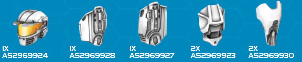
IX AS2969924 IX AS2969928 IX AS2969927 2X AS2969923 2X AS2969930