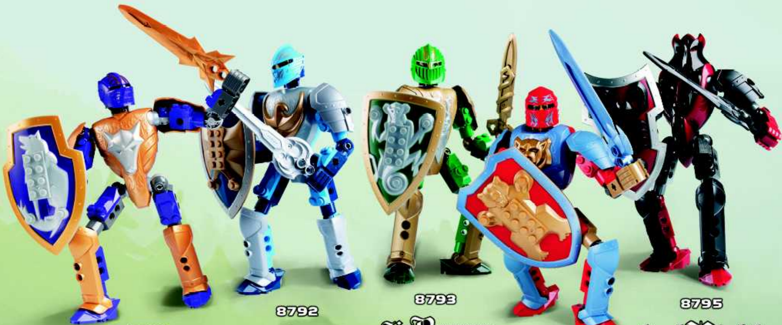
8791 Sir Danju