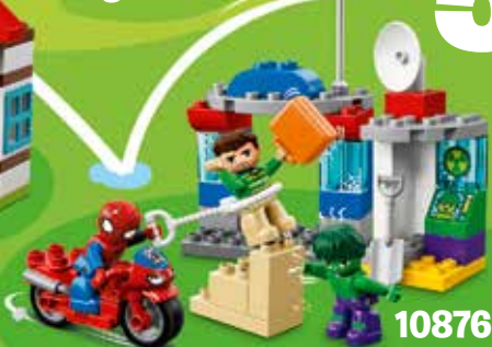
10876 Ages 2-5