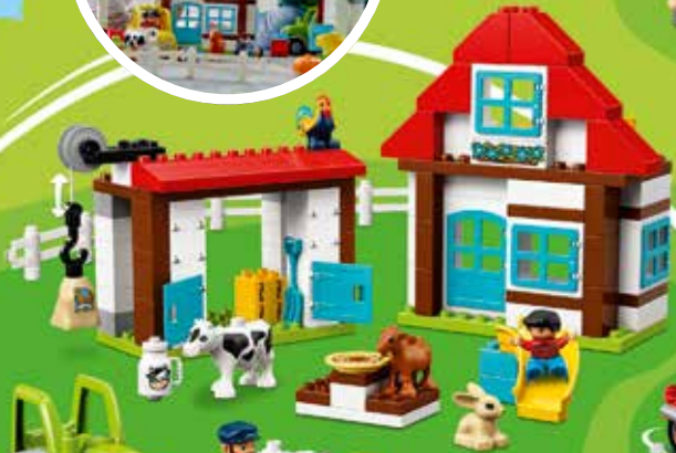
10869 Ages 2-5