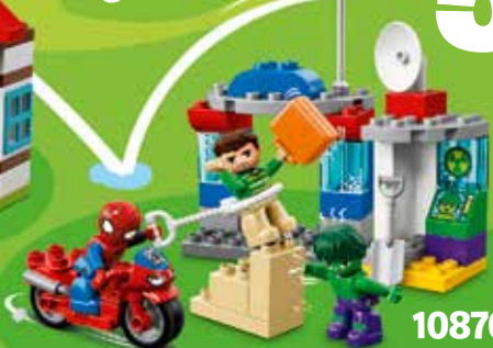
10876 Ages 2-5